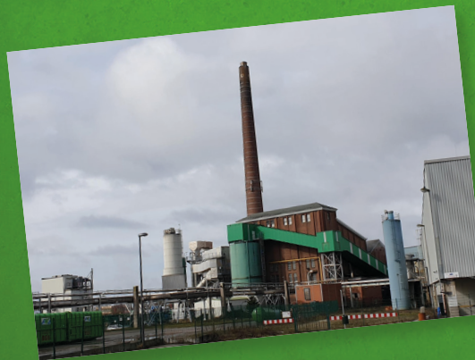
Müllverbrennung auf dem BWK-Gelände